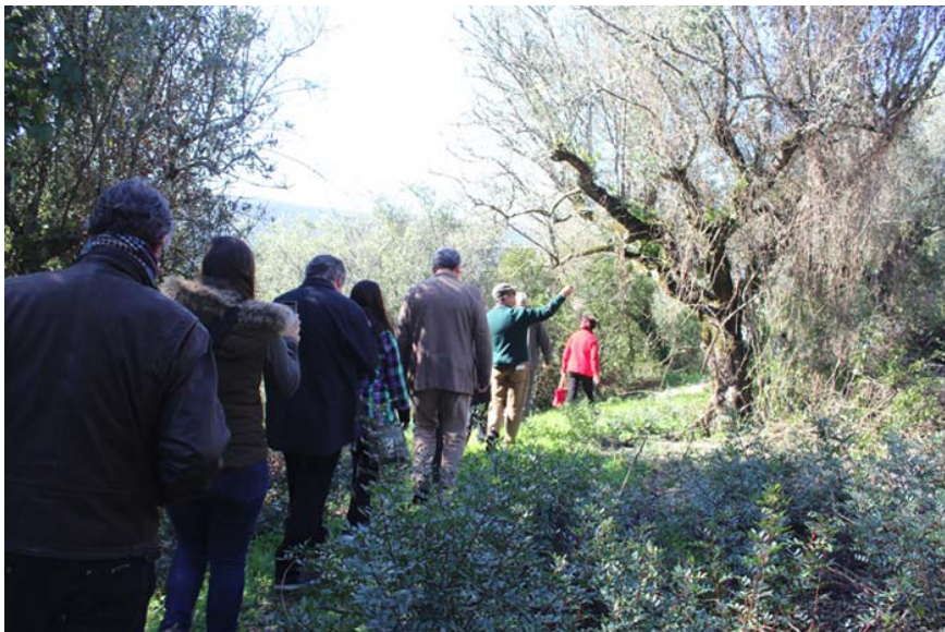
( http://jornaldeca.pt/wp-content/uploads/2017/02/circuitos_ciencia_viva_217.jpg )