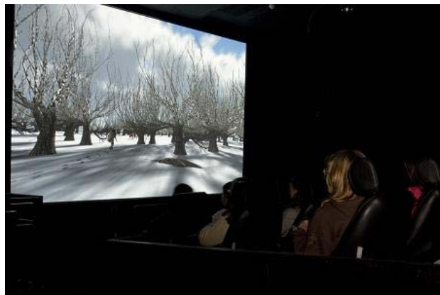
Mais de 5.000 visitantes no Centro Ciência Viva do Alviela

Ao completar quatro meses de actividade, o Centro Ciência Viva do Alviela – CARSOSCÓPIO contabilizou mais de 5.000 visitas, continuando a superar as expectativas da organização, dado que a carga máxima diária está limitada a pouco mais de 300 visitantes.