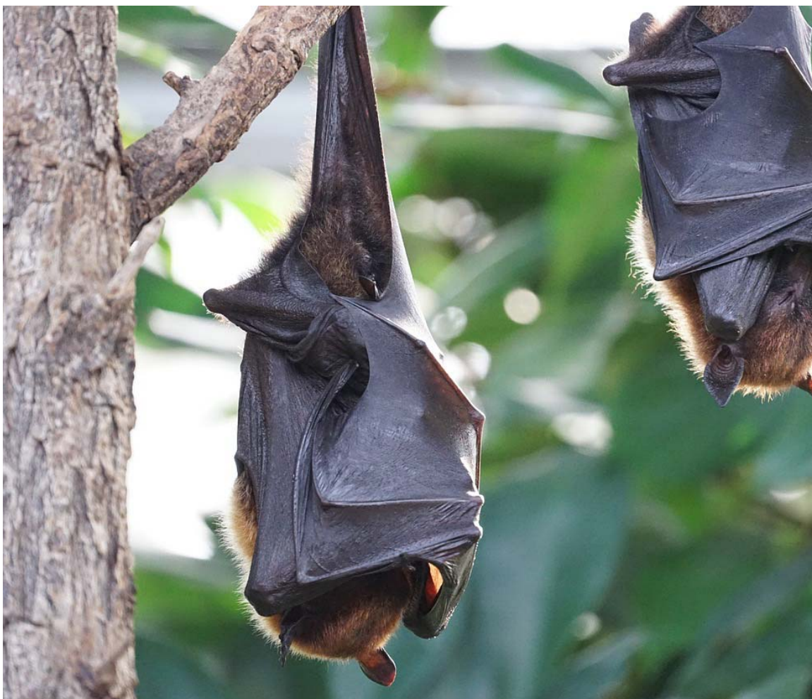
O Centro de Ciência Viva do Alviela promove sessões educativas sobre morcegos.

Nesta atividade, organizada no âmbito do programa de Promoção da Cultura Científica na Comunidade Intermunicipal do Médio Tejo (PEDIME), o investigador revelará dados fascinantes sobre o comportamento dos morcegos, apresentando uma investigação que desenvolve sobre estes animais.