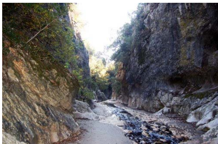
O conjunto flúvio-cársico da Ribeira dos Amiais é um dos candidatos às "7 Maravilhas Naturais de Portugal"