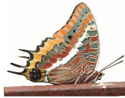
Borboleta do medronheiro