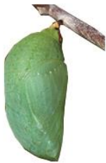
Crisálida ou pupa